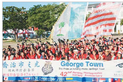
■ 约300名摄影发烧友以大旗鼓为主题拍摄槟城。