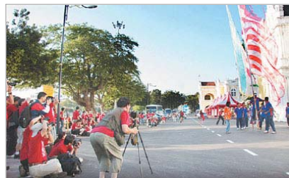
■ 拍下大旗鼓好手的英姿。